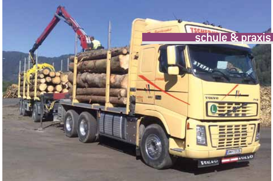
Abb. 3: Die Kranzeiten spielen beim Holztransport eine wichtige Rolle.