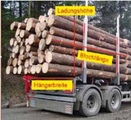
Abb. 2: Einfache Messungen zur Bestimmung des Raummaßes bei der Holzabfuhr